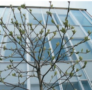
PL 35 (N) 40014 Jyväskylän yliopisto