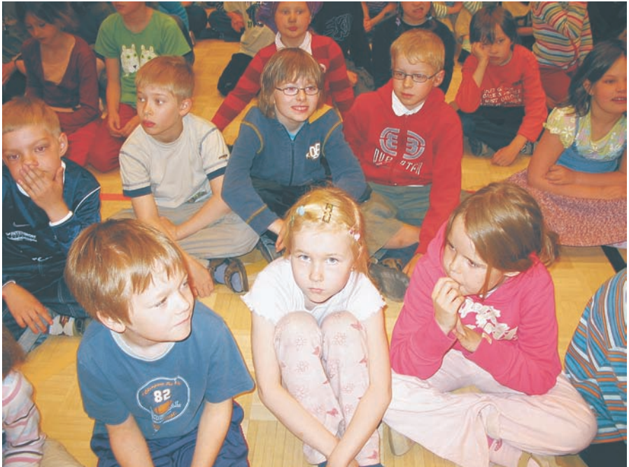
Kirjan ja Ruusun päivän juhla