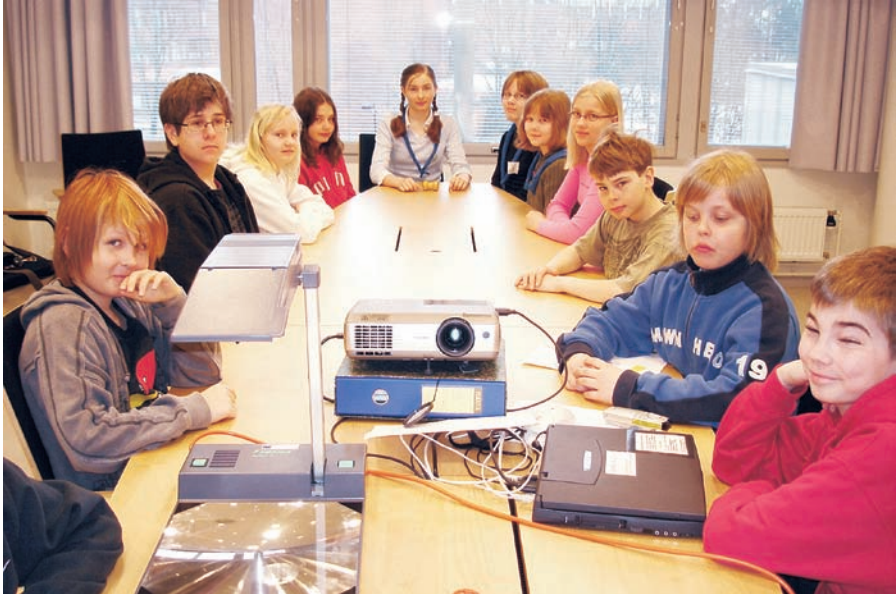
Alakoulun oppilaskunnan hallitus