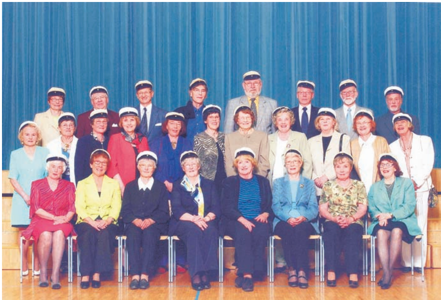
Ylioppilaat vuodelta 1955