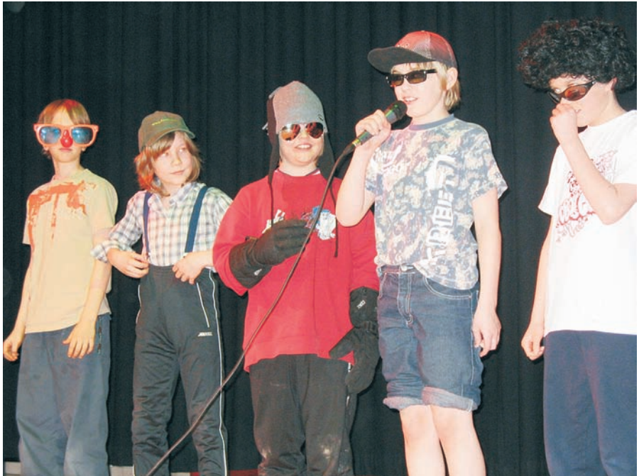
4b-luokan poikien tietovisailu