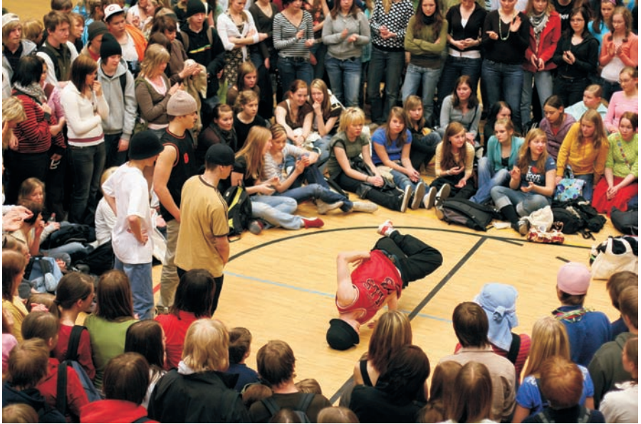
Taitavat breikkaajat lumosivat yleisönsä Norssirockissa