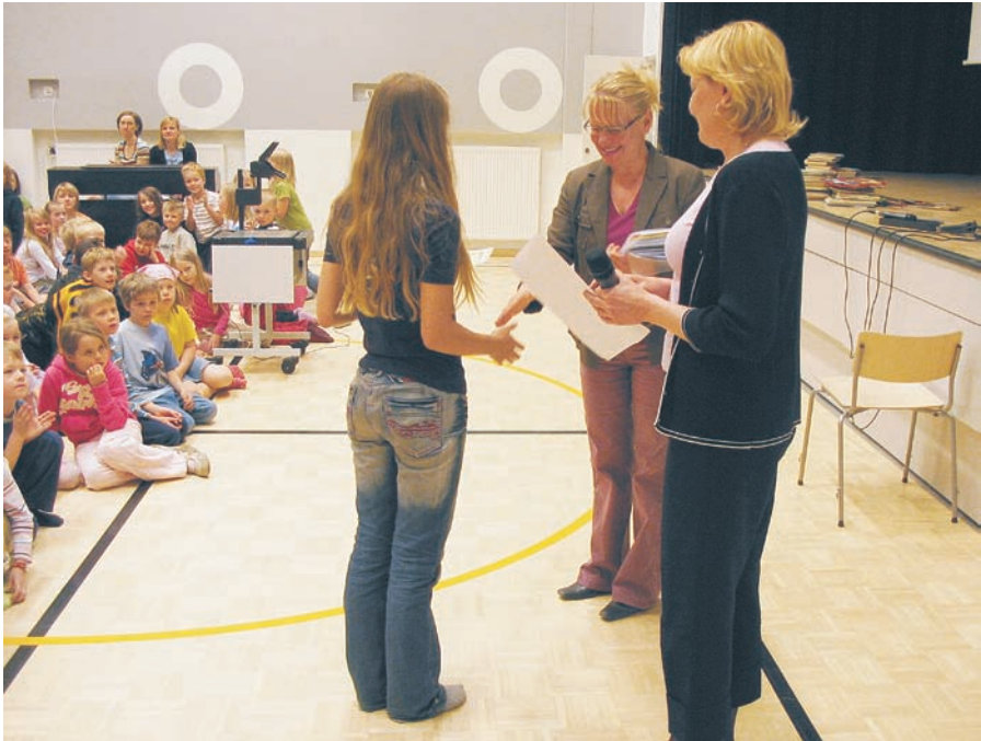
Juhlissa jaettiin 156 lukudiplomia