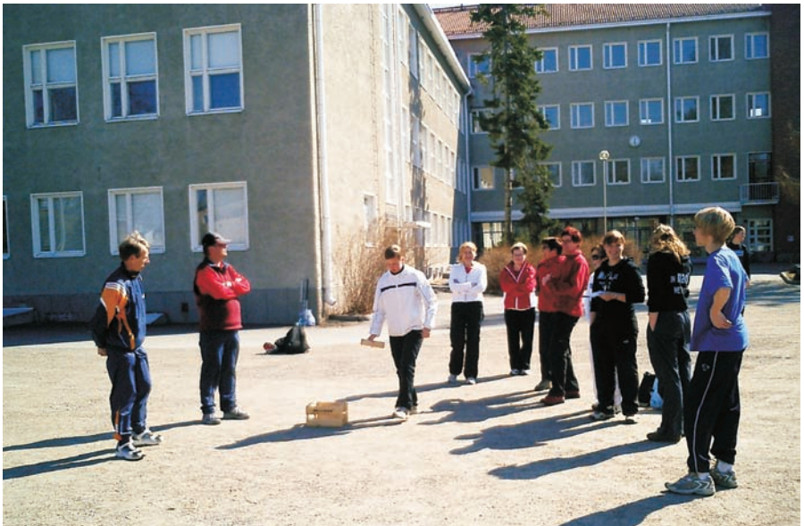
Malu -luokan 1B:n toimintailtapäivään lauantaina 29.4.2006 osallistui yli 50 luokan oppilasta, vanhempaa sekä oppilaiden sisaruksia. Iltapäivän aikana tutustuimme koululla toisiimme mm. pelaamalla mölkyä.