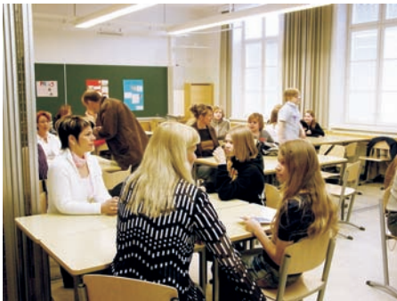
Tutustumisillan ohjelmaan kuului perheiden esittäytyminen toisilleen