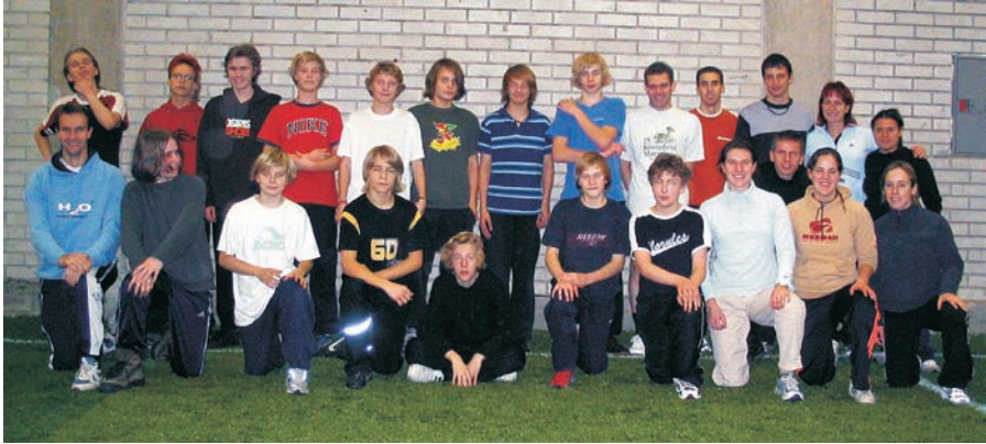
Liikuntapedagogiikan vaihto-opiskelijoiden ja 8-luokan poikien tunnit päättyivät jalkapallohenki- seen poseeraukseen.