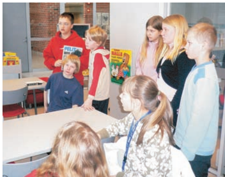
5b:n oppilaita kirjastossa