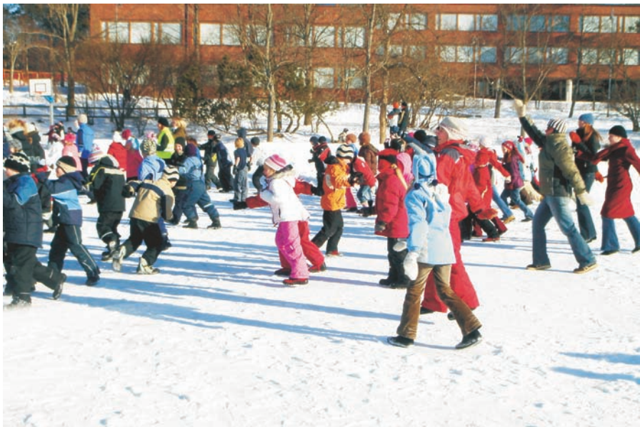
Alakoulu osallistumassa liikuntaennätykseen