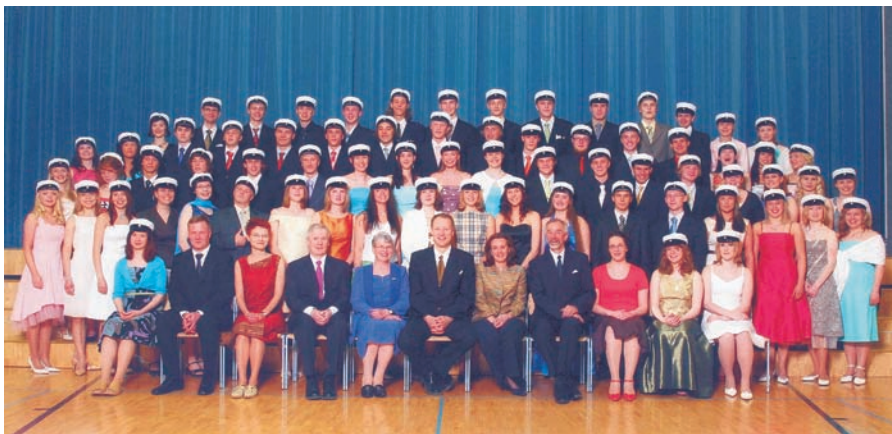
ja keväältä 2005