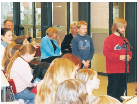
4b-luokan oppilaat harjoittelivat demokratiataitoja tunneilla ja valmistelivat kysymyksiä kaupunginjohtajalle.

Oppilaat ovat päässeet luontevalla tavalla harjoittamaan kielitaitoaan ja saaneet ruohonjuuritasolla tietoa eri kulttuureista. Kevätlukukaudella kaukaisin harjoittelija tuli Japanista. Hän ilahtui varmasti löytäessään luokastaan japaninkielentaitoisen tytön!