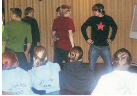
Vuokatin leirikoulussa ihailtiin "tähtien" esittämiä vanhoja tansseja

Ylimääräiselle velttoilulle ei jäänyt kauaakaan aikaa, koska aikataulu oli tiukka ja pian oli jo vuorossa hiihtosuunnistusta. Kovan pakkasen takia hiihtosuunnistusta lyhennettiin alkupe- räissuunnitelmista jonkin verran, eikä kukaan näin joutunut kokemaan pakkasen vaikutus-