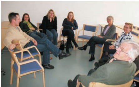
Ryhmädynamiikassa on voimaa

Matkan jälkeen olemme kokoontuneet keskustelemaan istunnosta ja omista kokemuk-