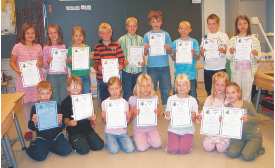
Kuvassa innokkaita lukudiplomin saajia ja mestarilukijoita 2a-luokalta