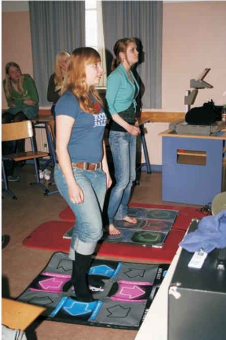
Ajatukset ja motoriikka yhdistyvät tanssimatolla