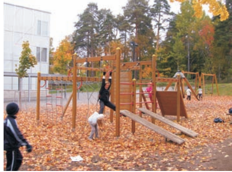
Jälkkäriläiset ulkoilevat päivittäin koulun pihassa