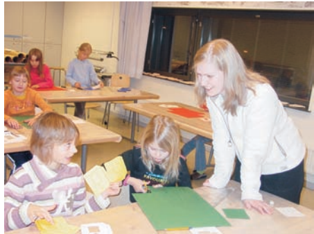
3c-luokka askartelemassa saksaksi