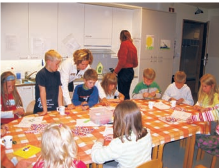
Helmitöiden tekoa kädentaitopajassa

Kiitos kaikille kummiopettajille kuluneesta vuodesta!