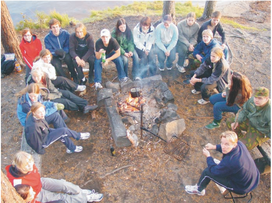
Nuotiotulet ja hyvä seura lämmittävät