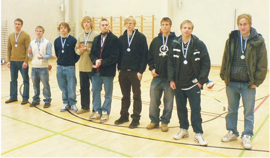
Hopeaa voittanut lukion koripallojoukkue