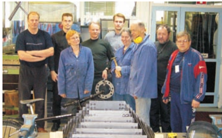
Teknisen työn kerholaisia

Normaalikoulun ja eri tiedekuntien yhteiset opettajankoulutuksen kehittämishankkeet on sisällytetty Jyväskylän yliopiston toiminta- ja taloussuunnitelmaan. Bolognan-prosessin tukena valtakunnallinen VOKKE-yhteistyö oli keskeisellä sijalla pedagogisten opintojen uuden opetussuunnitelman laatimisessa. Tämän työn pohjalta syyslukukauden 2005 alusta lukien on toteutettu valtakunnallisesti