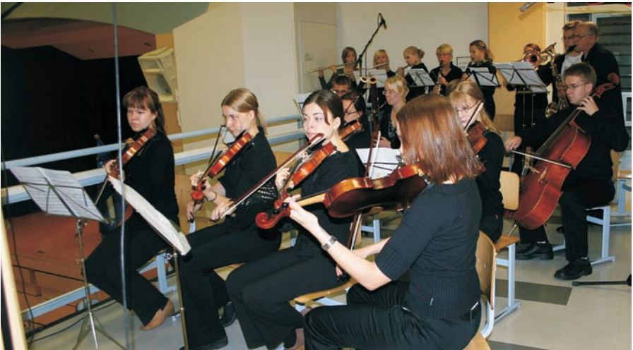
Norssin sininen soi Yliopiston Sinifksen ja Norssin Torvien yhteisesityksenä päiväjuhlissa

Julkaisusarjan 8. osan toimitti Kaija Nukari. Jyväskylän normaalkoulun vuosikirja 2005 Norssi tutkii ja kehittää sisältää kuvia ja raportteja koulussa parin viime lu-