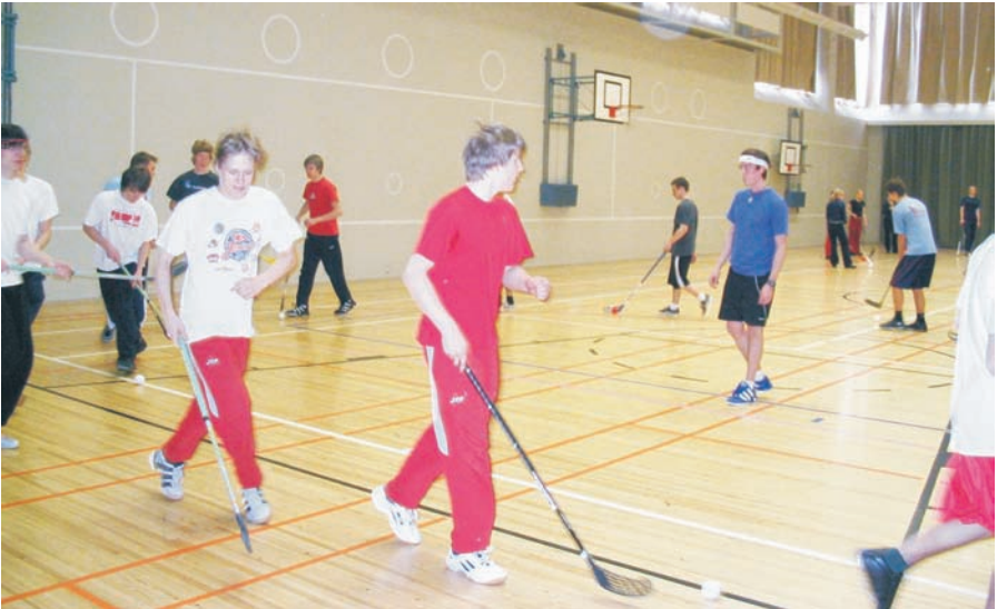
Norssin liikuntaluokkalaisia testaamassa liikuntatunnin motivaatioilmastoja yhdessä liikuntatie- teiden opiskelijoiden kanssa

toisiaan tehtäväsuuntautuneen motivaatioil- maston periaatteiden mukaan. Toisella tun- nilla mentiin kilpailusuuntautuneen ilmaston hengessä. Molemmilla tunneilla oli kolmella lukion oppilaalla erityistehtävänä olla lioitel- lun aktiivinen, passiivinen tai häiritsevä. Tuntia pitäneet liikuntapedagogiikan opiskelijat eivät tienneet tätä etukäteen. Juoni selvisi heil- le tuntien jälkeisessä palautekeskustelussa, jossa pohdittiin yhteisvoimin, miten erilaiset motivaatioilmastot näkyivät näillä tunneilla ja miten opettajat huomioivat erityistehtävän saaneet oppilaansa. Tällainen korkea-asteen yhteistyön Jyväskylän yliopiston liikuntatietei- den laitoksen ja Normaalikoulun välillä sai mo- lemmilta opiskelijaryhmiltä ja mukana olleilta opettajilta positiivista palautetta.