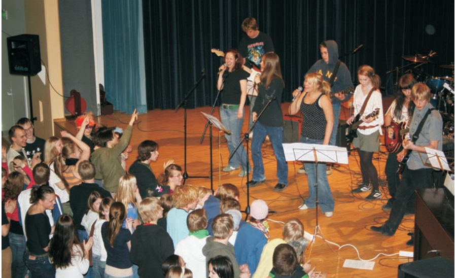
First Day soittaa Norssirockissa Rasmusta