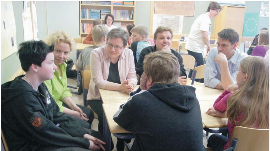
Myös vanhemmilla on mahdollisuus tutustua oman lapsensa luokkatovereihin perheiden yhteisissä tapahtumissa