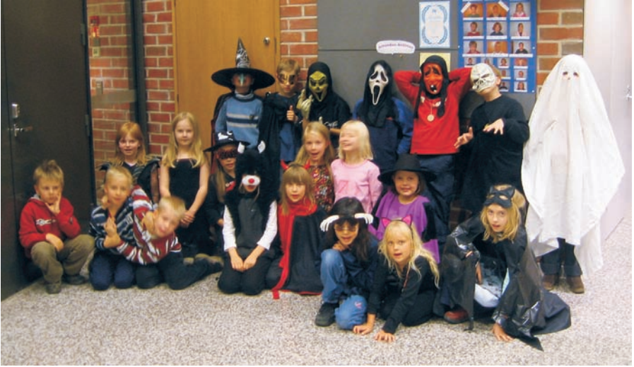
Halloween-kekkerit jälkkärissä lokakuussa