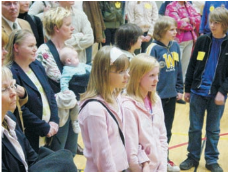
Uuden tilanteen jännitys näkyy kasvoilta seitsemännän luokan oppilaiden perheiden tutustumisillan alussa