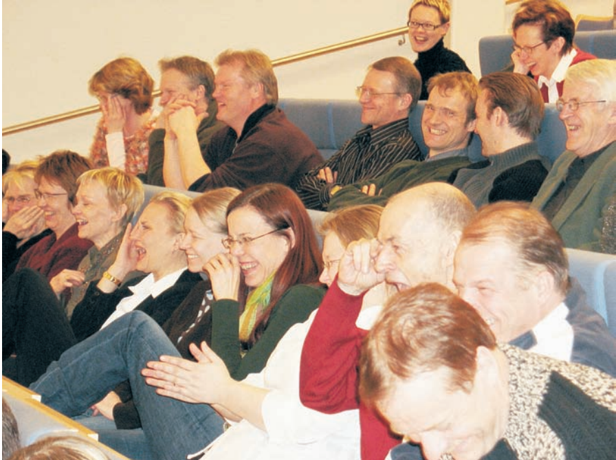
Pohdimme hyvinvointia erilaisissa ryhmissä ja monella tunnetasolla