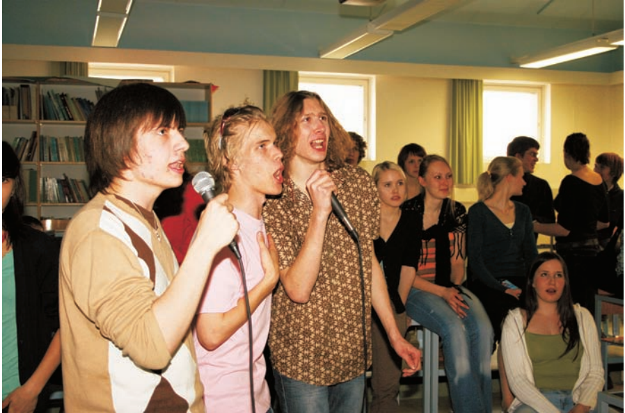
Afterrockissa kaikki halukkaat pääsivät esiintymään