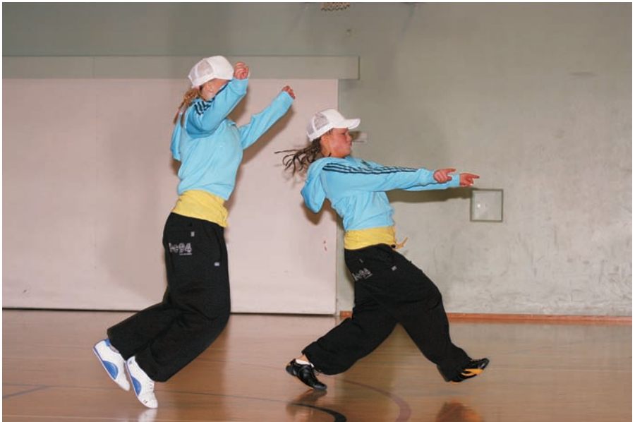
Hiphop-duo vauhdissa